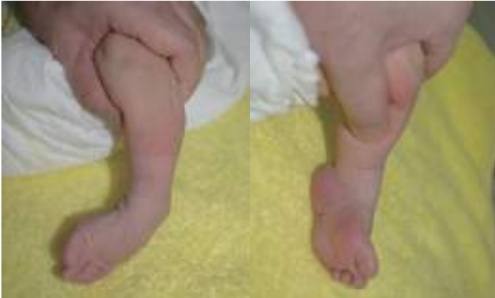
足の先が内下方を向く