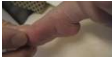
足が下を向いて足の裏が凹んでいる