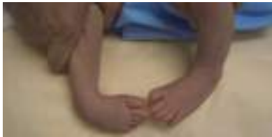
足の裏が内側を向き、足の先が内側を向く