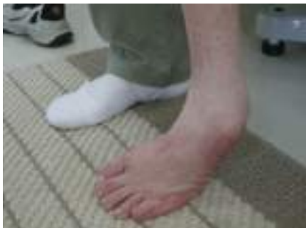
足の前外側で立ち、踵が浮く