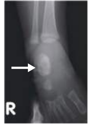
後方の2つの骨(距骨と踵骨)が重なっている(矢印)