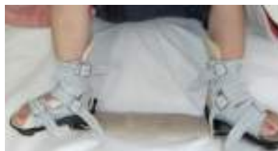
足部を70°外旋10°背屈保持する装具