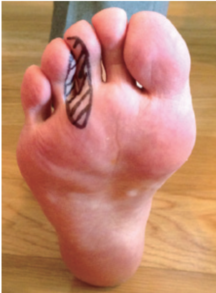
趾間の知覚異常の部位