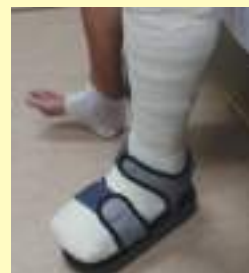
トータルコンタクト型ギプス

浅い：トータルコンタクト型ギプス（下腿から足部にかけてピッタリとフィットさせたギプス）、治療用中敷き、靴型装具などによる潰瘍部分への体重負荷の軽減 *感染を伴っている場合には抗生物質の投与が必要