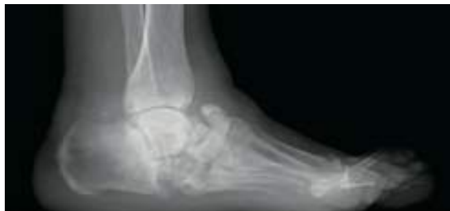
足部アーチの扁平化（X線像）