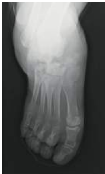
足の甲の関節破壊（X線像）