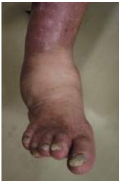
足部の腫れ、熱感、変形

シャルコー足とは、神経の障害により生じる足部の骨・関節における破壊性の関節症のことです。とくに糖尿病に多くみられ、足部が赤く腫れて熱をもつなどの症状が急性に発症し、感染と間違えることもしばしばあります。神経障害のため痛みが軽度でも、この状態を放置すると、靭帯弛緩や骨吸収、関節破壊をきたして足部の扁平化や、いちじるしい内外反変形が生じます。早期にギプスや装具などで対処すれば変形の予防は可能ですが、変形が進行してしまった場合には、骨の突出に潰瘍が繰り返し生じて感染を併発することがあるため、突出した骨の切除や関節固定術などの手術が必要となります。