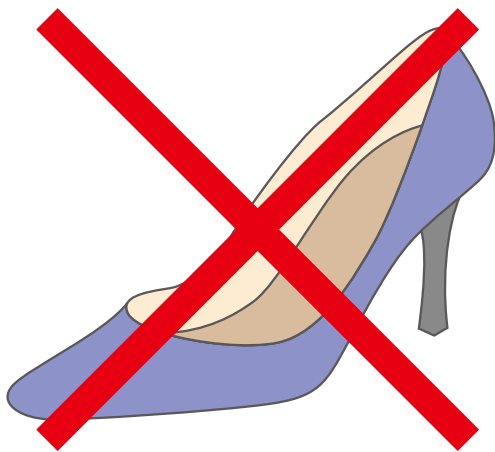
ハイヒールなどの使用を控えます